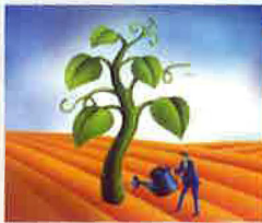
SAVINGS & FIXED DEPOSITS