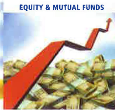
EQUITY & MUTUAL FUNDS